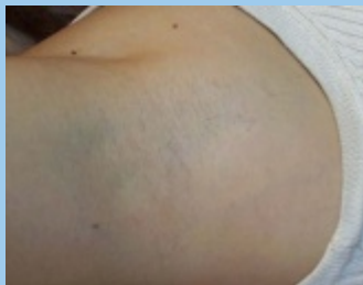
Na drie behandelingen